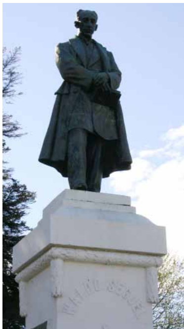
Monumento al juez Waldo Seguel en avenida Colón con Bories.

El 24 de agosto de 1866 se reglamentó la administración de justicia en el entonces territorio independiente de los jueces letrados de Valparaíso y Corte de Apelaciones de Santiago. Sin embargo, con el correr de los años, este sistema resultó totalmente insuficiente para atender sus necesidades y es así que se inicia un largo período en que se formularon múltiples requerimientos al gobierno central, para establecer en Magallanes un Juzgado autónomo al igual de los que había en el resto del país, ya que el existente ocasionaba un costo excesivo en los trámites judiciales, sumado a la lentitud que le restaba oportunidad y eficacia. El 17 de enero de 1894 se concretó esta