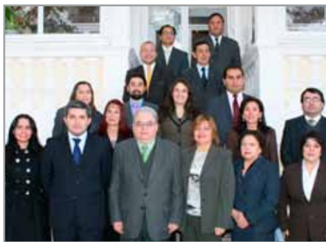
Al centro, el fiscal judicial Aner Padilla, junto a funcionarios judiciales de la Corte.