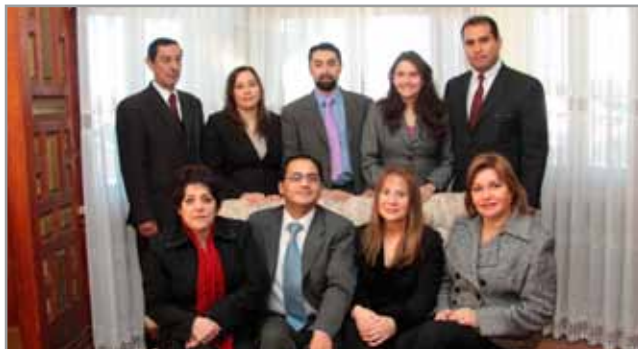
Personal de secretaría.