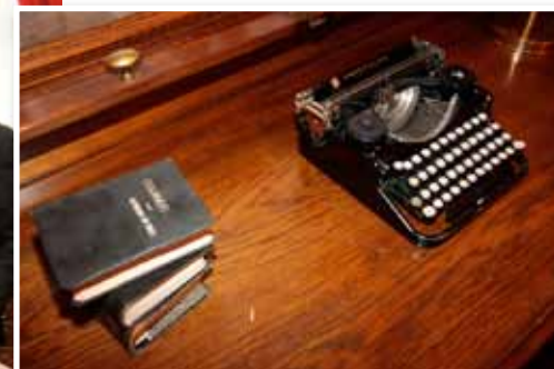
La máquina de escribir Underwood que usó el recordado juez Waldo Seguel se conserva como preciosa reliquia en la Corte de Apelaciones.